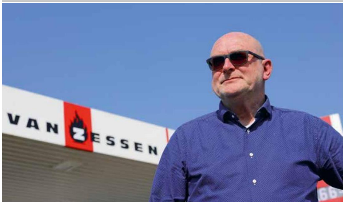
Tekst & Foto's: Geurt Mouthaan

Het is een uitzondering, benadrukt hij meteen ook. Want gezelligheid voert de boventoon aan de Driemolensweg. Voor Roel de With is een tankstation een soort kroeg, die naast benzine en diesel ook draait om sociale contacten. De locatie net buiten het dorp, bij de afslag naar de A27, is voor velen een bekende tussenstop. Niet alleen voor brandstof of het wassen van de auto in één van de wasboxen, maar ook om even bij te kletsen met een bak koffie in of buiten de shop. Zeker met mooi weer zijn de bankjes langs de muren en de picknickbankjes op het grasveld vrijwel altijd bezet. "Ze kunnen me geen groter plezier doen dan een compliment maken over mijn tankstation. Echt, dat streelt me elke keer weer. Je maakt soms zulke mooie momenten mee. Zo heb ik wel eens een huwelijksaanzoek gehad van een vrouwelijke klant. 'Zo'n vent wil ik wel', zei ze. Ik heb toch maar gezegd dat ik al getrouwd was. 'Dan ben ik jaloers op je vrouw', reageerde ze. Prachtig toch?" ■